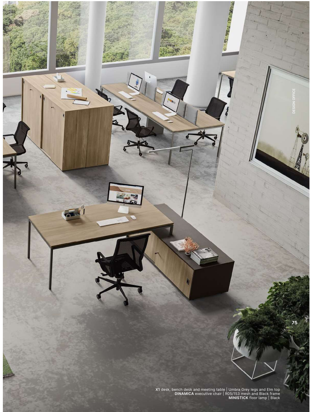
X1 desk, bench desk and meeting table | Umbra Grey legs and Elm top DINAMICA executive chair | R05/153 mesh and Black frame MINISTICK floor lamp | Black