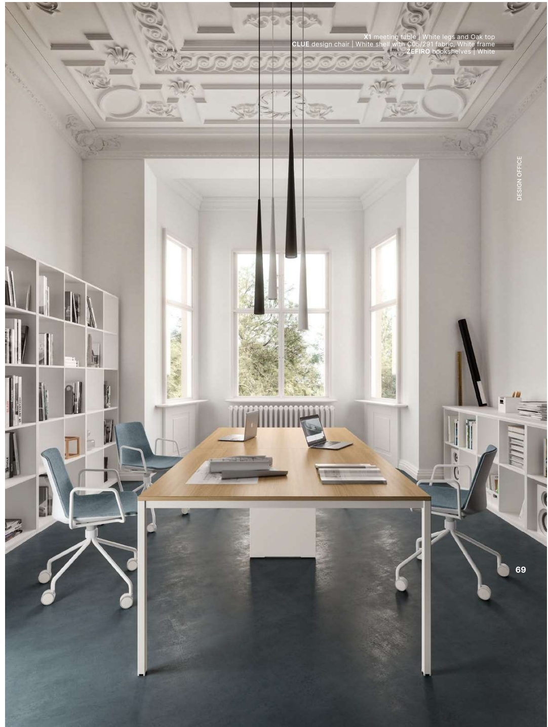
X1 meeting table | White legs and Oak top CLUE design chair | White shell with C05/231 fabric, White frame ZEFIRO bookshelves | White