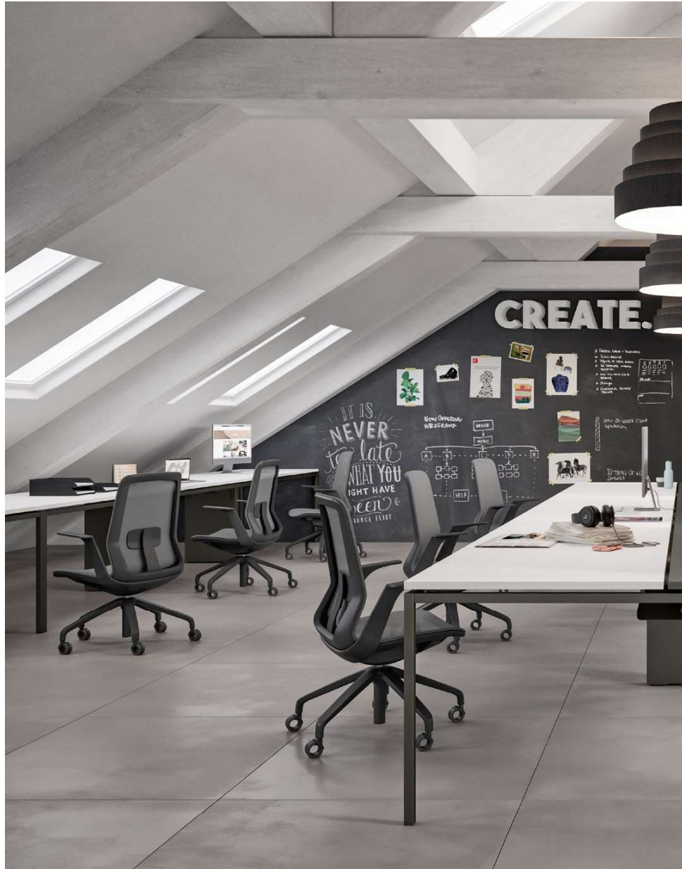
X1 bench desk | Umbra Grey legs and White top ODE task chair | R10/622 mesh and Black frame BABEL pendant lamp | Black shade