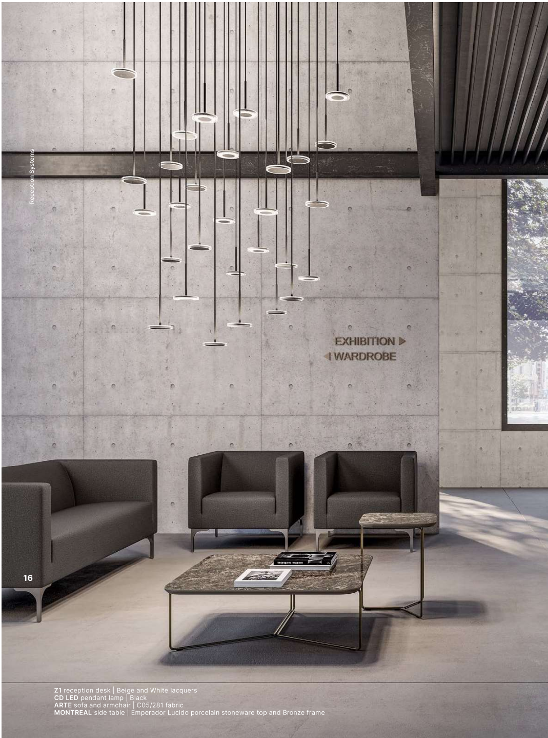
Z1 reception desk | Beige and White lacquers CD LED pendant lamp | Black ARTE sofa and armchair | C05/281 fabric MONTREAL side table | Emperador Lucido porcelain stoneware top and Bronze frame