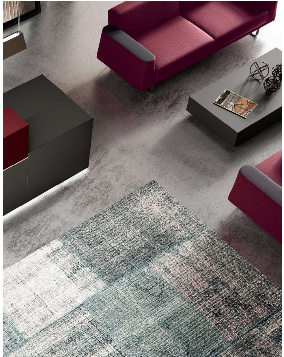
Z1 reception desk | Umbra Grey and Purple Red lacquers AVANA sofa | D02/277 fabric and B03/184 simil leather BLONDE pendant lamp | Bronze