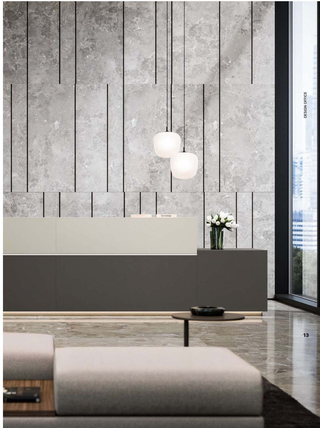
Z1 reception desk | Umbra Grey and Silk Grey lacquers AVANA composable sofa | M01/556 fabric and P01/095 leather AFRA pendant lamp | White acid-etched glass shade