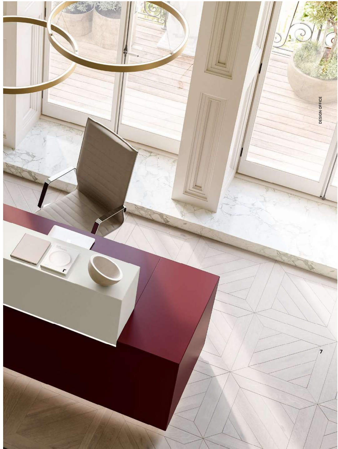
Z1 reception desk | Purple Red and Silk Grey lacquers DIVA SOFT executive chair | B03/185 simil leather PLANET pendant lamp | Gold