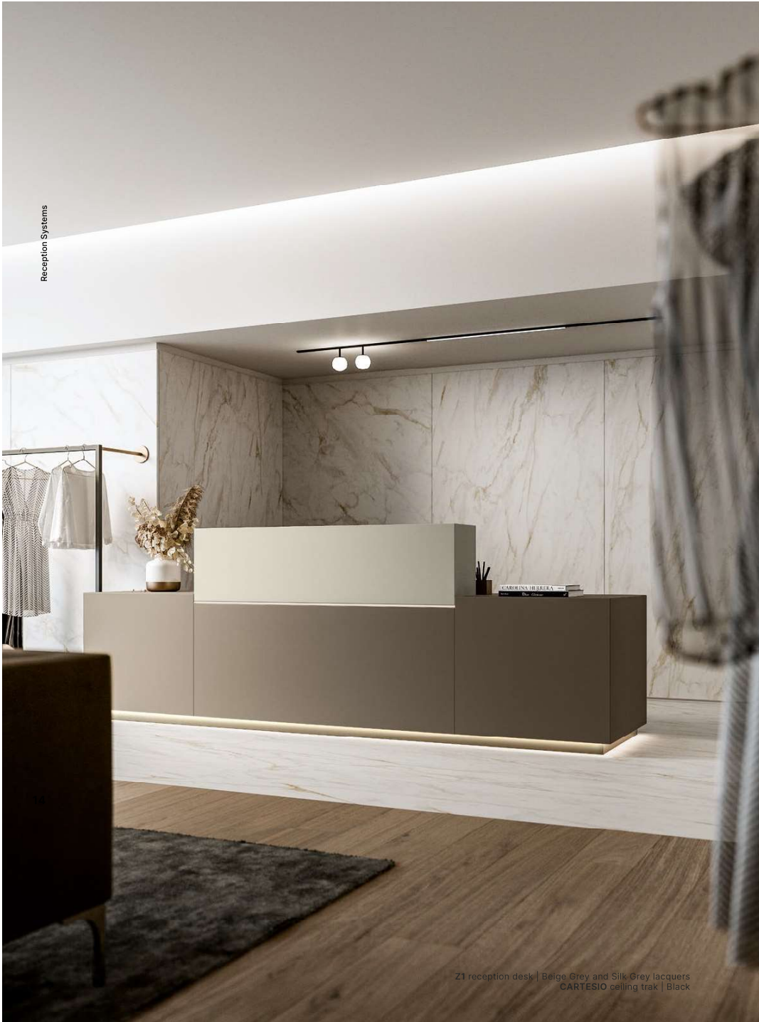
Z1 reception desk | Beige Grey and Silk Grey lacquers CARTESIO ceiling track | Black

The LED lights complete the composition, illuminating the space and creating a welcoming atmosphere.